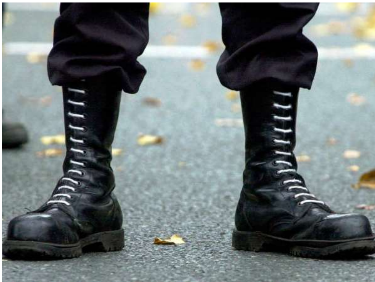
Gli anfibî – die Springerstiefel